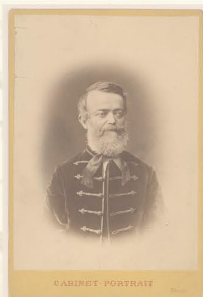
Szabó Károly (1824–1890)